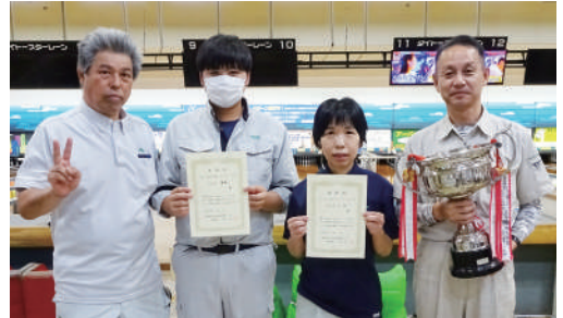
▲団体の部優勝 国土防災技術(株)B