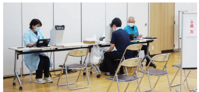
▲視力検査を受ける従業員

定』野菜の摂取量を測る『ベジチェック』を実施。今回の結果を今後の自身の健康意識向上に役立ててほしい。