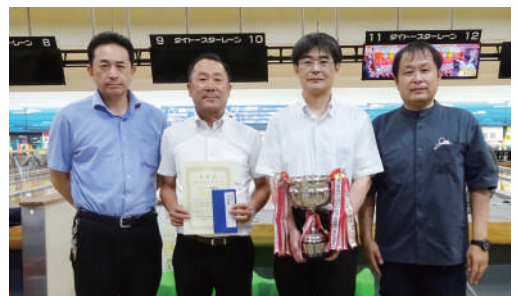
▲団体の部準優勝 (株)マルモA