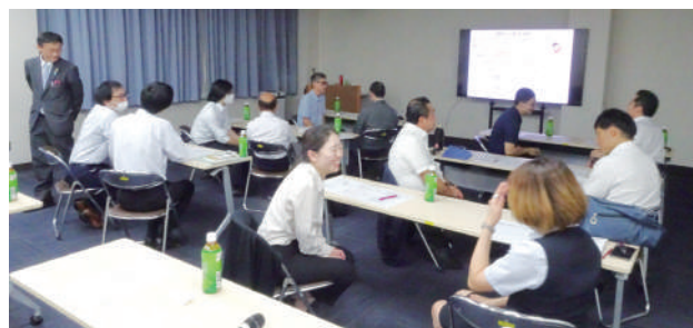
▲動機づけ面接を実践する参加者

受講者は、「実際に体験的にコミュニケーションをとったことで、自分の考えを客観的に捉えることができた」「変わることへの自信がどんどん大きくなっていった」など、動機づけ面接の効果を実感したセミナーとなった。