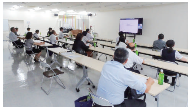
▲zoomを利用したセミナー

レーションで紹介され、資料の読解・要約、指示通りに画像・動画を作製、翻訳・意識、情報・データの処理など様々な活用方法を説明し、セミナーを終えた。