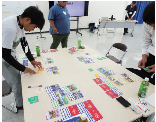
▲カードゲームを体験する参加者たち

参加者からは「ゲームを通じて、自分たち一人ひとりの行動から世界が変わっていくことを実感できた」「目標を達成するためには周りの人たちとの情報共有が大切だということが分かった」などの声上がり、SDGsへの意識が変わる有意義なワークショップとなった。