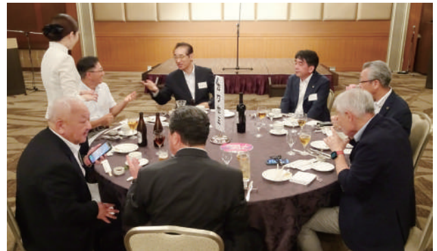
▲懇親を深める出席者たち▲